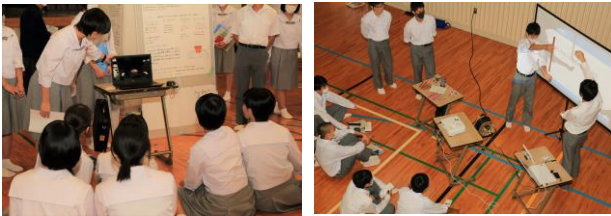
△写真左：学類ごとに体育館と講堂に分かれ、発表している様子。

10月23日(金)に探究Ⅱの中間報告会が行われました。2年生の探究Ⅱでは、88の班が構成され、多様なテーマの課題研究が行われています。この中間報告会では、それぞれの研究の進捗状況について発表され、意見交換や指導助言を受ける場となりました。