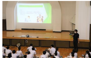
△講堂での合同オリエンテーションの様子。

10月13日(火)の探究Ⅰは、2年次「探究Ⅱ」に向けての合同オリエンテーションが行われました。