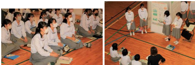
△中間報告会に参加している様子（1年生）。

今回の中間報告会には3年生の代表者や、1年生も参加しました。3年生には、発表に対してアドバイスももらいました。貼ってもらった GOOD・QUESTION シールのコメントや、先輩達のアドバイスをもとにこれからの研究をよりよいものにしてください。