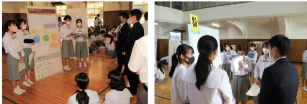
△今回の報告会では“GOOD シール”に加えて、「問い」や「疑問」などを“QUESTION シール”にコメントして貼ってもらいました。

今回の中間報告会には3年生の代表者や、1年生も参加しました。3年生には、発表に対してアドバイスももらいました。貼ってもらった GOOD・QUESTION シールのコメントや、先輩達のアドバイスをもとにこれからの研究をよりよいものにしてください。