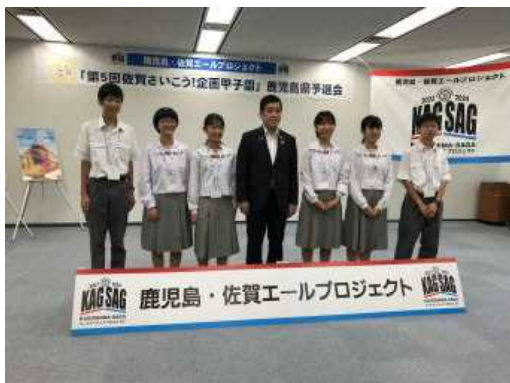
（知事と一緒に記念撮影）

取材やプレゼン資料の作成，繰り返し練習した成果が見事形となりました。おめでとうございます！